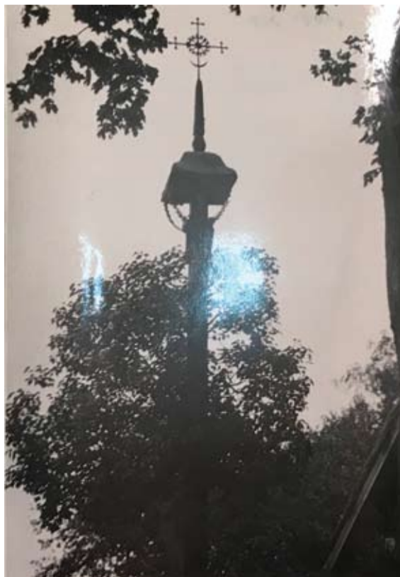
Ūkininko Aniceto Češūno sodybos stogastulpis.