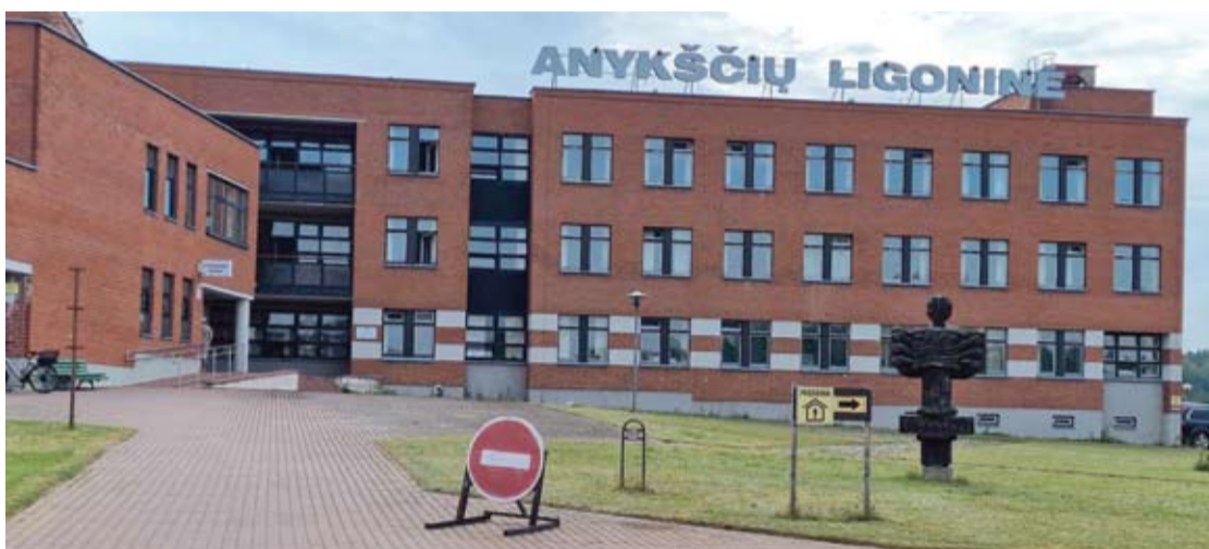
Kojų skausmu skundėsis anykštėnės tėtis iš Anykščių ligoninės nebegrižo.