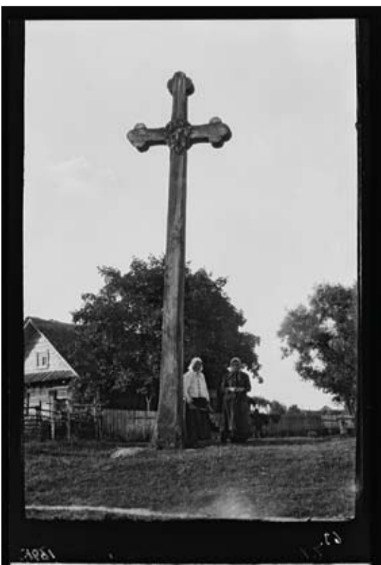
Kryžius prie Skiemonių vieškelio Anykščių miestelio pakraštyje, 1927 m. Pastatytas 1892 m.